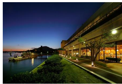
安芸グランドホテル

当社では、本キャンペーンを通じて、当該エリアへの積極的商品造成および集中送客を図るとともに、着地型観光商品の開発や、地域の観光資源を生かした新たなイベントの開発や地域交流事業にも取り組んでまいります。