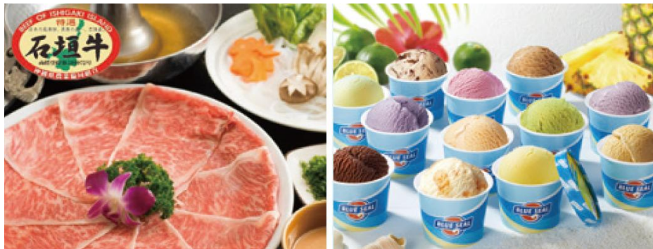
豪華賞品（左）石垣牛特選リブコースすき焼き（右）ブルーシールアイス詰め合わせ 12個入り

内閣府沖縄総合事務局が実施する事業で、沖縄県内の農林漁業関係者や食品製造事業者と観光事業者等と結びつける取組等の実施により、県産農林水産物・食品の販売を促進し、域内の農林水産業及び関連産業の活性化を図ることを目的とする。