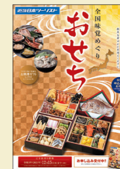
全国味覚めぐり おせち

近畿日本ツーリストは、各店舗およびWebサイトで、12月15日まで(一部商品を除きます。)全国味覚めぐりのおせちを販売しております。ぜひお買い求めいただき、すてきな新年をお迎えください。