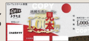
地域共通クーポン券