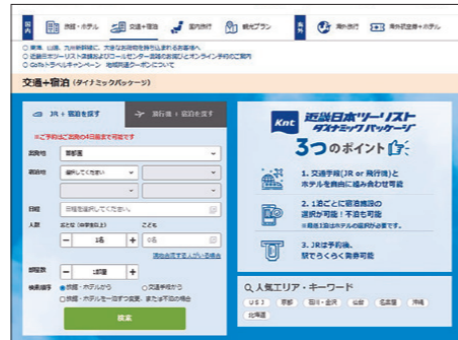
「近畿日本ツーリスト ダイナミックパッケージ」のサイト画面

また、予約の早期化が可能となり、JRの予約受付開始日は従来の「3か月前」から最大「6か月前」に、航空機の予約受付開始日も従来の「6か月前」から「約1年前」に早くなりました。さらに航空運賃は需給に応じて日々変動しますので、閑散期においては従来より安価に旅行を楽しんでいただくことが可能です。「近畿日本ツーリスト ダイナミックパッケージ」の特徴は、OTA(オンライン専門旅行会社)の場合と異なり、JRと宿泊の自由なセット購入も可能なことです。ぜひご利用ください。