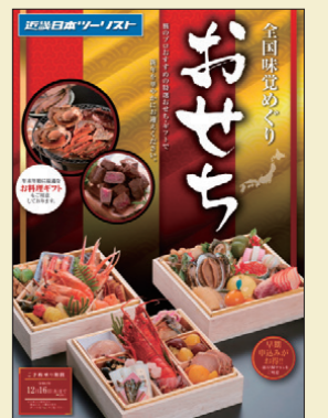
全国味覚めぐり おせち

近畿日本ツーリスト各店舗では、12月16日まで(一部商品を除きます)全国味覚めぐりのおせちを販売しております。ぜひお買い求めいただき、すてきな新年をお迎えください。