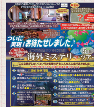
海外ミステリーツアーのパフレット

出発直前まで行き先がわからないドキドキ感が魅力のミステリーツアー。1991年より国内ミステリーツアーを手がけてきたクラブツーリズムでは、本年9月海外ミステリーツアーを初めて実施しました。今回の行き先ドバイは、当日空港で初めてお客さまに発表され、以降ブルジュ・ハリファの展望台、アブダビの大統領官邸などを周遊しました。ヒントは数少なく、正確な行き先が明かされない中でのツアーでしたが、お客さまからは「砂漠のホテルの雰囲気がとても良かった」や、第2弾を期待する声をいただくなど、好評のうちにツアーは終了しました。次回の海外ミステリーツアーは2カ国周遊で2020年1月、2月出発を予定しています。また、本年6月にはツアー中に起こる事件を解決していく、まるでサスペンスドラマの中に迷い込んだような体験型の謎解きツアーも実施しました。クラブツーリズムでは、これからもオリジナリティに富んだテーマ旅行を展開してまいります。