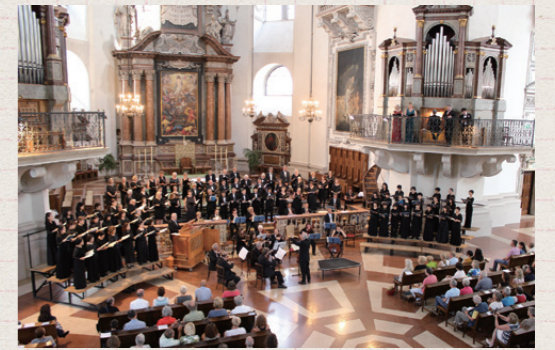
ザルツブルク大聖堂でのお客さまによる公演の様子

毎年モーツァルト生誕の地で開催され、世界中から名だたるオーケストラや指揮者が集まる「ザルツブルク音楽祭」。そのステージで仲間とともに合唱する——そんな音楽ファン垂涎の体験ツアーをクラブツーリズムが実現させました。ツアーのお客さまで構成される「クラブツーリズム合唱団」のメンバーは、一緒に旅・合唱をする仲間として、著名な音楽家の指導による練習を積み重ね本年7月に現地へ出発、本番ではモーツァルトゆかりの大聖堂で「戴冠ミサ」と「レクイエム」を見事に歌いあげ、大きな感動を生みました。クラブツーリズムでは「歌うシリーズ」として、今後も思い出に残るツアーを提供してまいります。