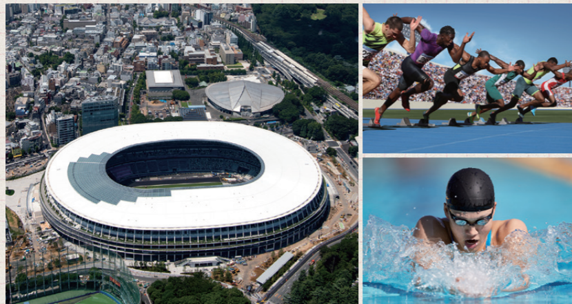
建設中のオリンピックスタジアム

KNT-CTホールディングスは、東京2020オフィシャルパートナー（旅行サービス）として、全国で東京2020オリンピック公式観戦ツアーを発売しています。