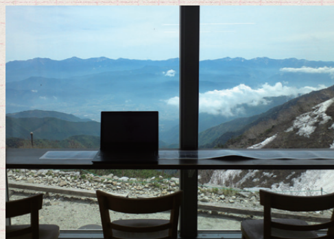
「ホテル千畳敷」の特設オフィス

働き方改革の一環として、観光地など職場から離れた場所で勤務するテレワークが注目されています。当社グループでは、さらに地域とのふれあい活動を織り込んだ「ワーケーションツアー」(「ワーク」+「バケーション」の造語)を各地で提案しています。