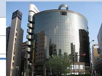
ホールディングス 本社ビル全景