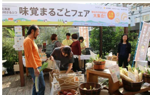
味覚まるごとフェアの様子1