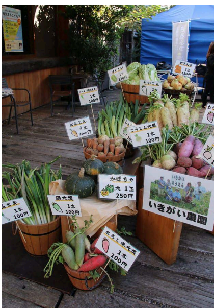
味覚まるごとフェアの様子2